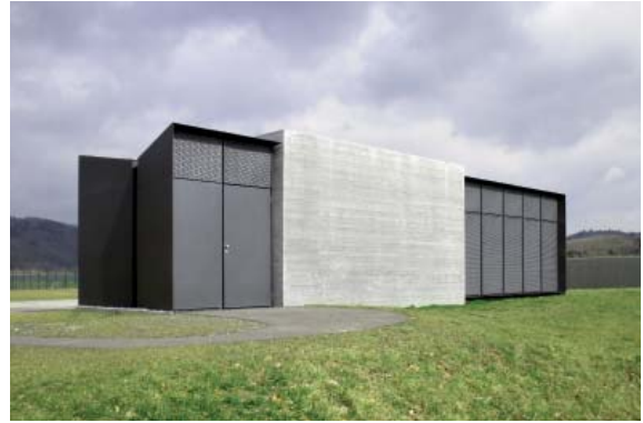
Schaltschrank | Trafo | WC